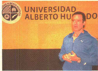
EXALUMNO DE INGENIERÍA COMERCIAL UAH, SOCIO FUNDADOR DE GULLIVER, EMPRESA DE INNOVACIÓN WEB 2.0.