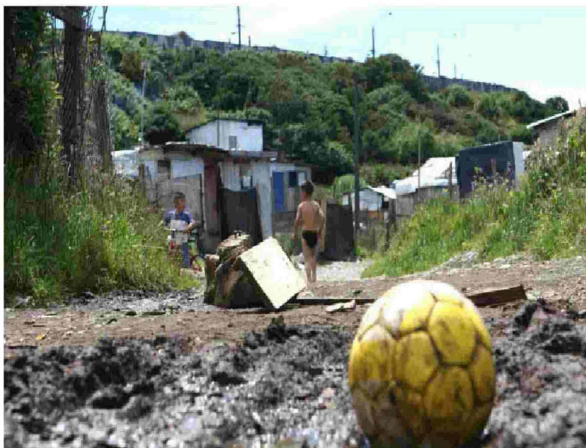
Un 2,4% creció la pobreza en la Región de Los Lagos entre los años 2006 y 2009, según la encuesta Casen.