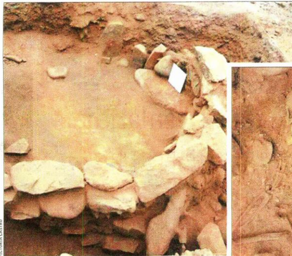
Los restos humanos en Copaca están dispuestos en una estructura de piedra de forma semicircular situada a unos 100 metros de la costa.

Uno de los individuos presenta dos conchas de erizo bajo el cráneo, probablemente con algún fin ritual.