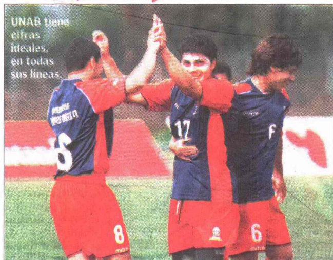
UNAB tiene cifras ideales, en todas sus líneas.

En la fase de grupos, la única escuadra que sólo conoció victorias fue la Universidad Andrés Bello . Sus cuatro triunfos la colocaron como el equipo de mejor rendimiento. Entre los elementos que destacan en sus estadísticas está el mantener su valla invicta. De hecho, la UNAB es la única escuadra que no ha recibido goles. Lleva 320 minu-