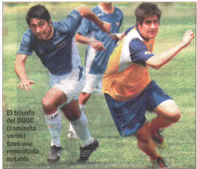
El triunfo del DUOC (camiseta verde) tuvo una remontada notable.

go Castro (de penal), DUOC sumó tres puntos, que a la postre serían fundamentales para quedarse con el grupo. "Acostumbramos a jugar con dos volantes de corte y dos volantes externos que se proyectan. Como íbamos 2-0, saqué un contención para sumar otro de creación, y cambié un volante externo por otro delantero", explicó el DT Miguel Ramírez.