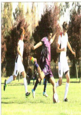
Universidad de Chile, con camiseta blanca, expuso un buen juego colectivo ante el laborioso elenco de la Ucinf.