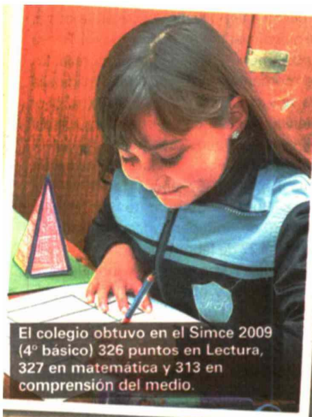
El colegio obtuvo en el Simce 2009 (4° básico) 326 puntos en Lectura, 327 en matemática y 313 en comprensión del medio.