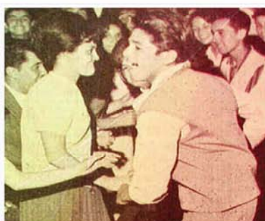
Adolescentes bailan twist en la Plaza Arturo Prat de Iquique durante una fiesta organizada por la revista "Rincón Juvenil" en 1965: la imagen oficial del Congreso.