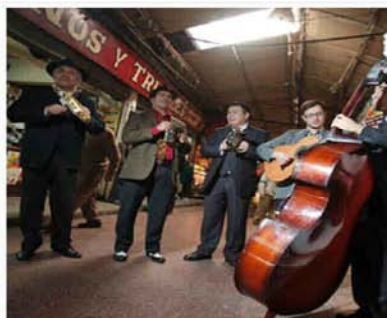
Los Chinganeros, custodios de la cueca

Va a haber punk, cueca, grindcore , jazz, bossa nova, cumbia, hip-hop, comparsas del altiplano y canto a lo poeta entre otras opciones. Y es sólo parte de la programación de los tres días de música que se registrarán esta semana en Santiago, pero no exactamente para tocar en vivo, sino para hablar y reflexionar sobre esos y otros asuntos.