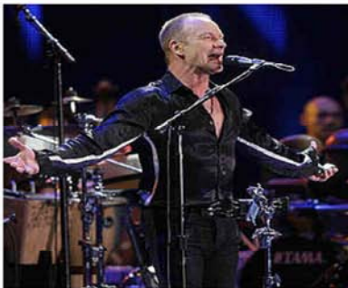
Sting, sinfónico durante el pasado Festival de Viena: "Sting y el arte de acompañar", es la ponencia de la investigadora Rubi Carreño (sábado 11, 9.00 horas).