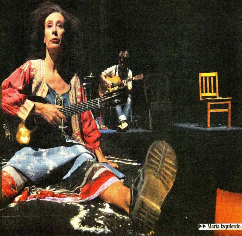
►► María Izquierdo.