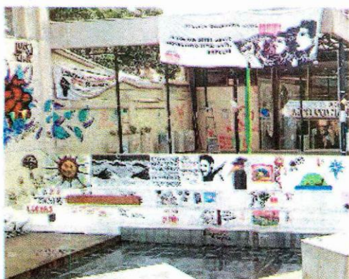
▶▶ Patio Central de la Universidad Alberto Hurtado.