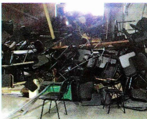
▶▶ Una de las salas de clases.