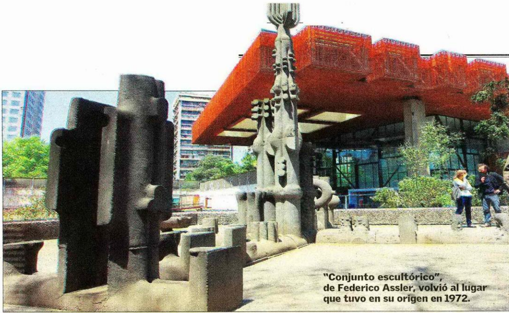
"Conjunto escultórico", de Federico Assler, volvió al lugar que tuvo en su origen en 1972.