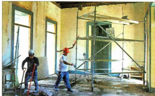
REFACCIÓN. — Esta es una de las habitaciones de una construcción anexa, la "Casa del Sagrario", que también está siendo sometida a trabajos de reparación.