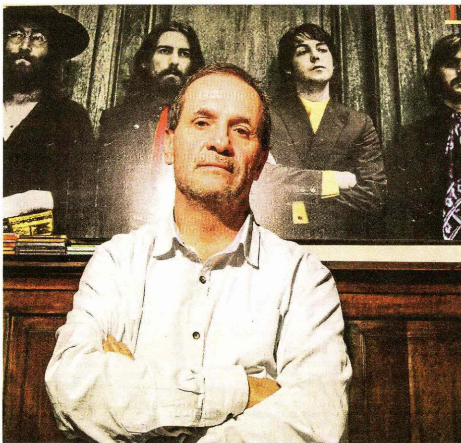
►► El también académico de la Universidad Alberto Hurtado.

► Dice que no se aproblemata con un mundo tan ajeno: “Si viene SQP, yo los recibo feliz”