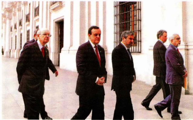
La semana pasada, los rectores de las universidades no estatales del Cruch acusaron "discriminación" de la reforma.

● ¿Cuándo enviarán la reforma? Según anunció la Presidenta, este mes presentará la reforma, por lo que debería enviarla esta semana. Además, el miércoles 29 la Confech hará una jornada de propaganda y el jueves 30 se reunirá el Cruch.