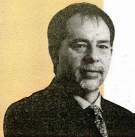
GUIDO GIRARDI Jefe del comité de senadores del PPD

“Hemos tenido reuniones con los rectores en función de ver dónde están los puntos de acuerdo y desacuerdo en los aspectos centrales de la reforma”.