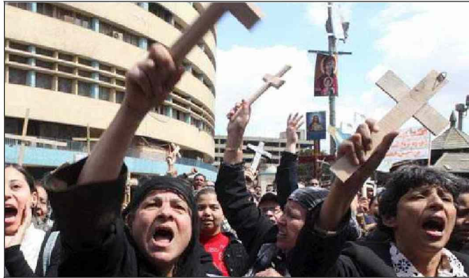
Cristianos coptos egipcios participan en una manifestación.

Señala Samir Khalil Samir: "Se vive la omnipresencia del islam. La radio predica y canta el Corán: en el autobús, en el taxi, en la calle. Los programas de televisión son interrumpidos 5 veces al día para la oración. Todos los niños reciben la enseñanza coránica, bajo la premisa de ser una buena base para la lengua. Ningún cristiano puede enseñar el árabe. Tampoco pueden estudiar o ejercer la ginecología. Para construir una iglesia se requiere un permiso del gobierno".