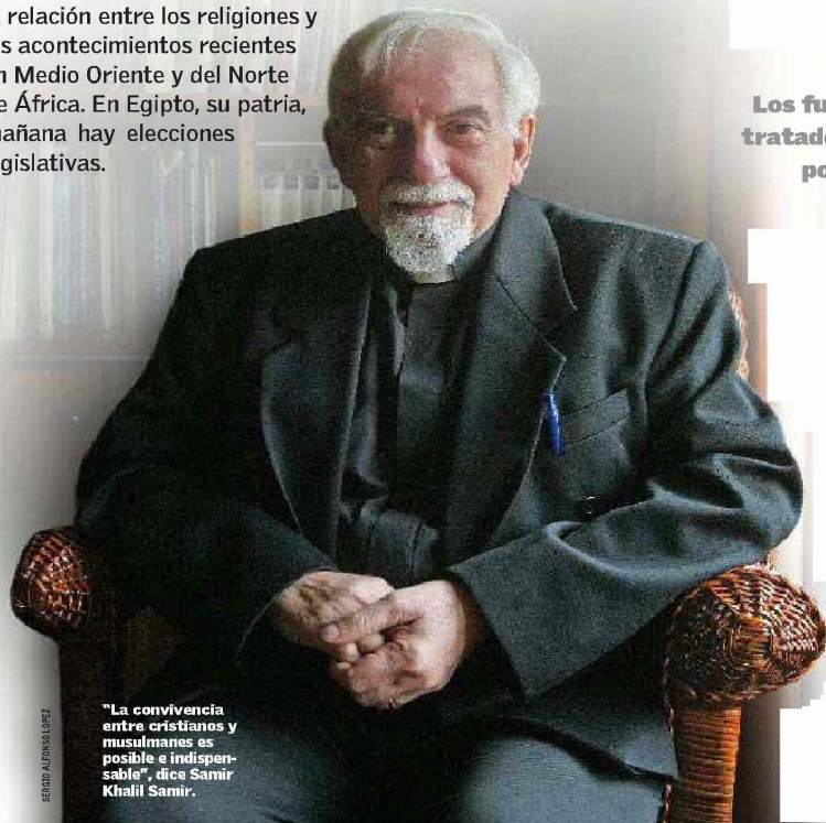
SERGIO ALFONSO LÓPEZ

Samir Khalil Samir es un reconocido especialista en temas islámicos y en la relación entre cristianismo e Islam. Como cristiano árabe inmerso en el mundo musulmán, de visita en Chile, ofrece su visión sobre la relación entre las religiones y los acontecimientos recientes en Medio Oriente y del Norte de África. En Egipto, su patria, mañana hay elecciones legislativas.