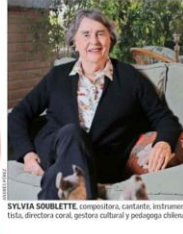
SYLVIA SOUBLETTE , compositora, cantante, instrumentista, directora coral, gestora cultural y pedagoga chilena.