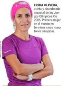
ERIKA OLIVERA , atleta y abanderada nacional de los Juegos Olímpicos Río 2016. Primera mujer en el mundo en terminar cinco maratones olímpicos.