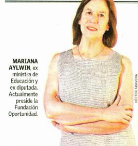
MARIANA AYLWIN , ex ministra de Educación y ex diputada. Actualmente preside la Fundación Oportunidad.