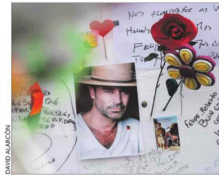
El recuerdo eterno de los famosos.

El estudio se realizó durante la segunda y tercera semana de octubre y recogió encuestas telefónicas a 481 personas de ambos sexos, de 18 a 80 años, de las ciudades de Santiago, Coquimbo, La Serena, Valparaíso, Viña del Mar, Concepción y Talcahuano. Por primera vez también incluyeron preguntas sobre los niños y la muerte (ver recuadro).