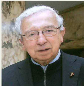
*Rector U. Alberto Hurtado

A esto, le sumamos la propuesta de que las universidades firmen un «contrato» con el gobierno. El problema es saber en qué consistirá. En la primera área, uno quisiera un estatuto más claro para las estatales, que acepten líneas fundamentales – no puedo entender que la U. de Chile haga un Pedagógico en el mismo lugar donde está la UMCE –. La segunda área es la de los privados que quieran suscribir ese «contrato». Sus términos se tienen que precisar bien. Y la tercera área es la de las universidades que no van a suscribir contrato. Ahí hay que cuidar que no se produzcan universidades segregadoras y segregadas.