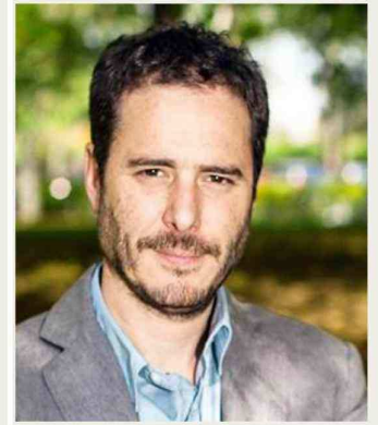
*Director ejecutivo Horizontal

En tercer lugar, debe construir un futuro. Y eso exige la configuración de un proyecto político fundado en una teoría de la justicia basada en la libertad y acompañada de un programa de cambios. Demanda el terminar con los conflictos internos, mostrando un sentido colectivo en su acción política. Así, la gran salida para el sector es mostrar unidad más que diferencias. Levantar propuestas alternativas a las reformas del gobierno, más que limitarse a las críticas y posiciones de trincherera. Debe dar por superada a la Alianza, construyendo una nueva coalición amplia y diversa. Necesita dibujar un proyecto político para la gran clase media, antes que dedicarse a promover candidaturas y caudillos. El camino es duro, pero la oportunidad está ahí.