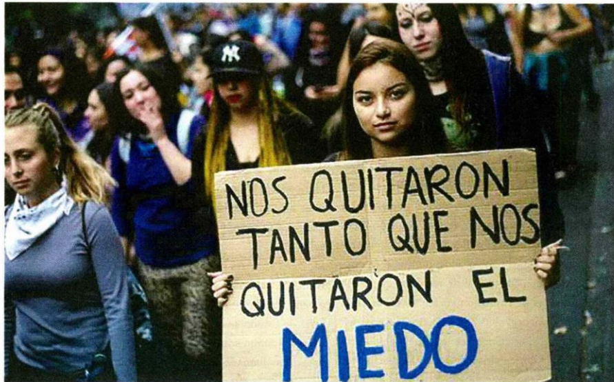
Las mujeres perdieron el miedo y salieron a las calles a manifestarse.