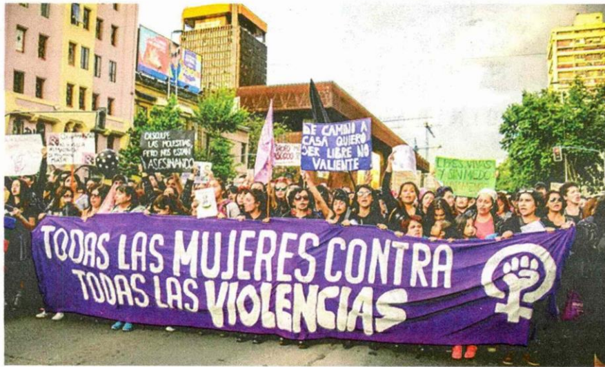
La movilización de las mujeres ha causado sorpresa en Chile