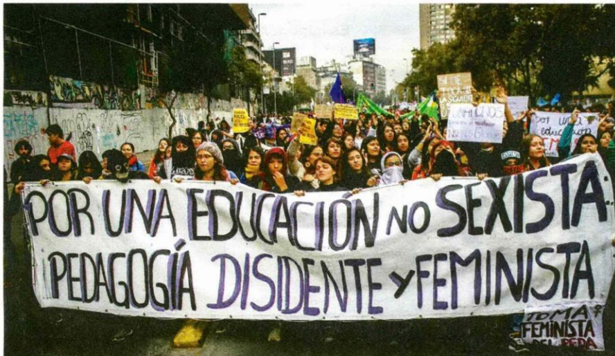
Las transformaciones son el primer paso para hacer los cambios.