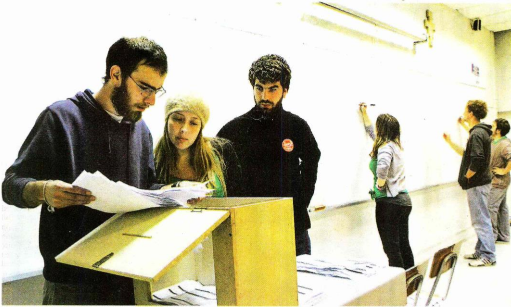
►► Conteo de votos en las elecciones estudiantiles de la Universidad de Chile, en 2013.