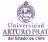
UNIVERSIDAD ARTURO PRAT