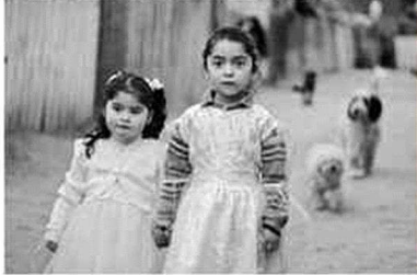
© Magdalena Carolina Cruz Caballero, Sin título