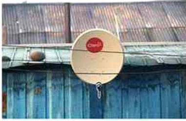
© Dafne Belén Núñez Ávila, La Pobreza en HD