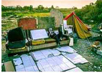
© Héctor Leonardo Montecinos González, Living