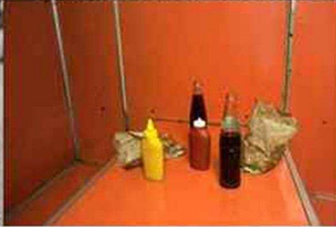
© Mauricio Duarte Arratia, Sin título

En la Estación Metro Quinta Normal se encuentra instalada la exposición "Don de Ver". Se trata de miradas actuales a la pobreza de Chile seleccionadas en un concurso para fotógrafos aficionados y profesionales organizado por el Hogar de Cristo con la Universidad Alberto Hurtado. La muestra se podrá visitar hasta el 20 de septiembre.