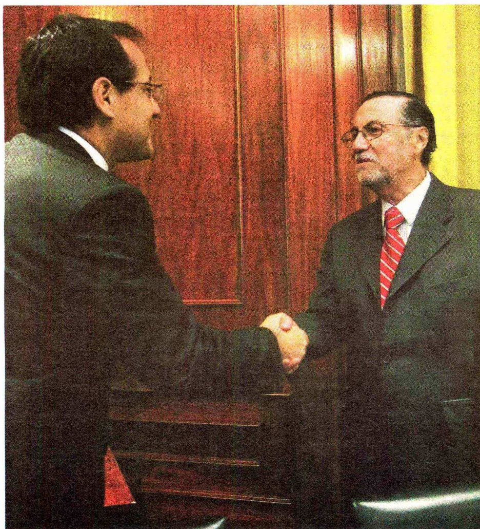
▶ El Mineduc hizo su propuesta la primera semana de marzo.