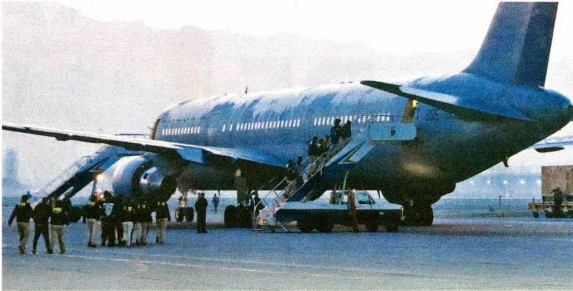
► Efectivos de la PDI en el operativo que terminó con 51 colombianos expulsados del país.