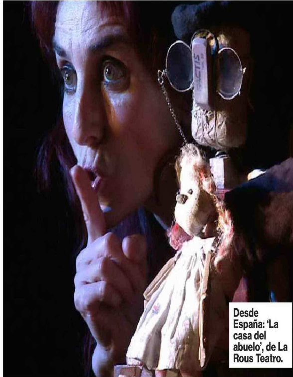
Desde España: 'La casa del abuelo', de La Rous Teatro.

Los principales escenarios se asocian para presentar 33 obras nacionales e internacionales, desde el 12 de julio.