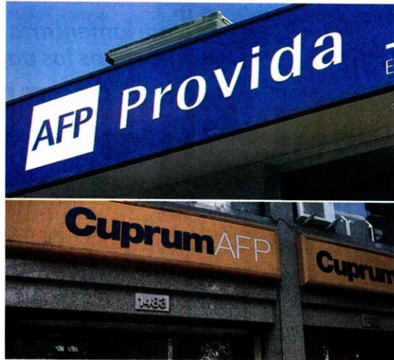
Las AFP Provida y Cuprum son las que cobran las más altas comisiones y tienen menos rentabilidad.