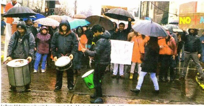
La lluvia del domingo en la capital y en varias ciudades del país, afectó a la marcha No+AFP puesto que muchos prefirieron no desafiar el mal tiempo por temor a enfermarse.