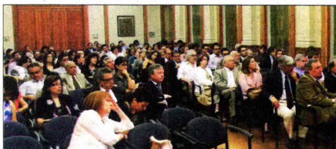
Varios personajes públicos, entre ellos Magdalena Piñera y Harold Mayne-Nicholls, fueron ayer al lanzamiento del libro en el Centro de Extensión UC.