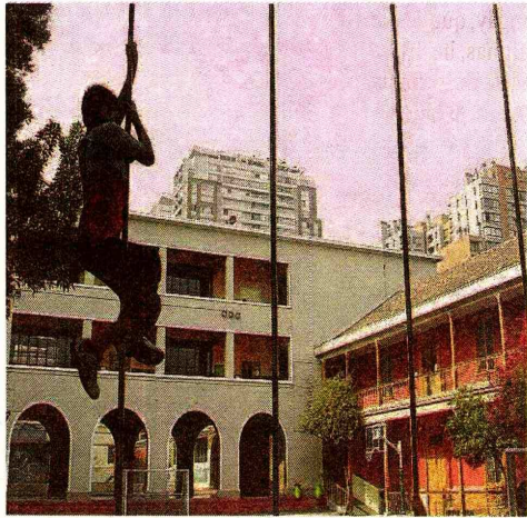
▶▶ En el establecimiento de calle Alonso de Ovalle estudian 1.340 alumnos.