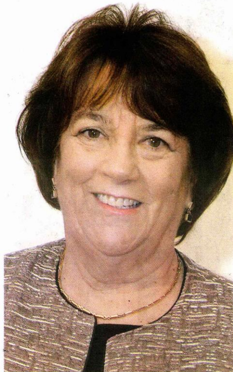
La ministra, Adriana Delpiano, dijo que "la gratuidad es voluntaria".