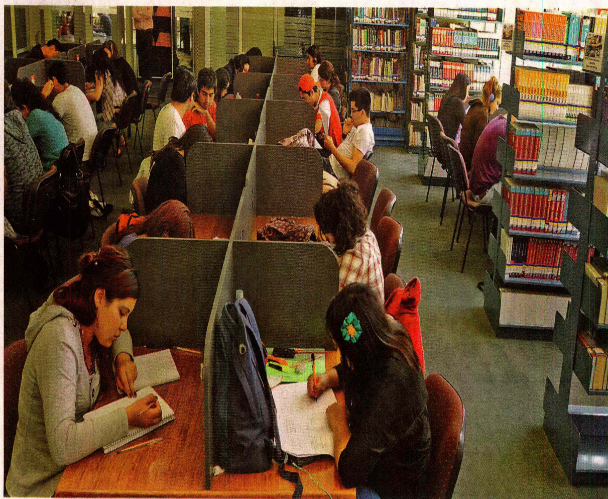
Se está estudiando la incorporación de un ranking que tome en cuenta el lugar que un estudiante ocupaba en su establecimiento de acuerdo a sus notas de enseñanza media.

El Consejo de Rectores está analizando otras modificaciones para su proceso de admisión único, al que ya se sumaron ocho planteles privados. Algunas de éstas tienen que ver con ajustes en las pruebas de Ciencias y de Lenguaje y Comunicación.