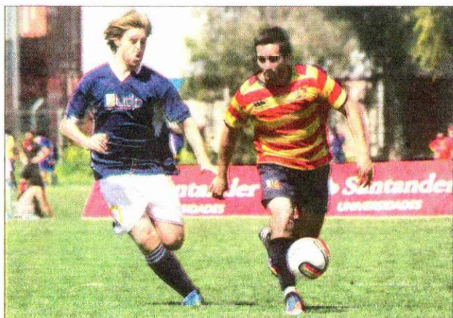
U. Santa María (camiseta listada) sigue invicta en la Copa Universia. El viernes superó a la U. Diego Portales.

Por otra parte, la Universidad Finis Terrae debutó en el torneo con un empate a 1 ante la Universidad Central, en una serie que se mantiene compacta en el puntaje y que, en dos jornadas de la Copa Universia, ha mostrado cinco cuadros de similares aptitudes y desarrollo futbolístico.