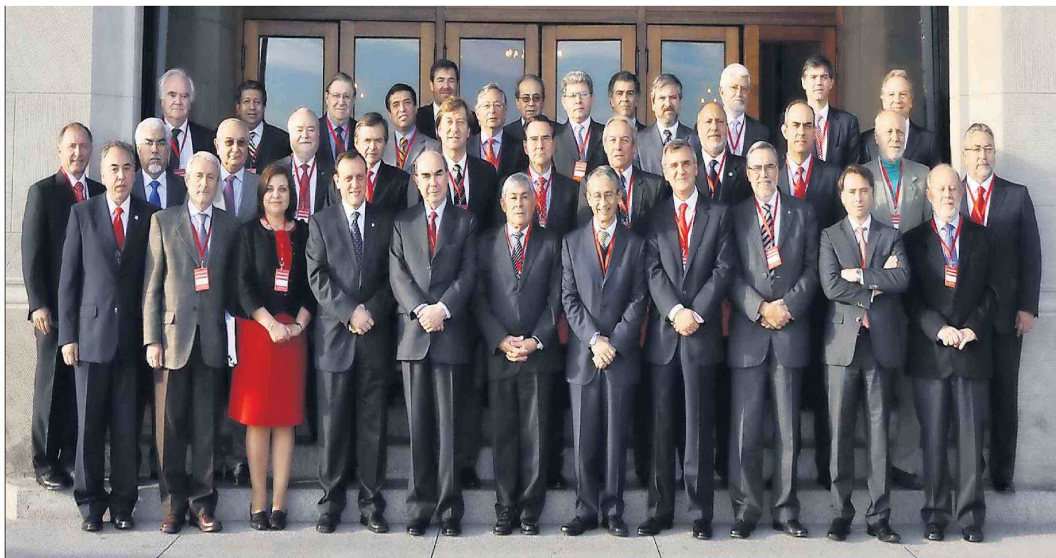
Los representantes de las 38 universidades participantes.