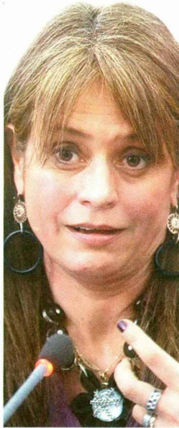
Jacqueline van Rysselberghe, presidenta de la UDI.