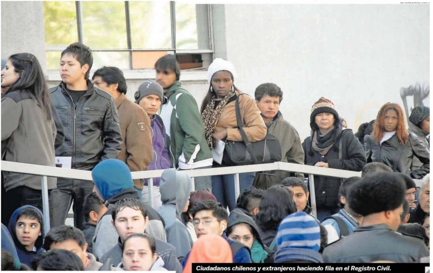
Ciudadanos chilenos y extranjeros haciendo fila en el Registro Civil.

Aseguran que en aeropuertos chilenos son apartados de la fila para ser interrogados y que no se pueden comunicar con los funcionarios del servicio público. Presentaron un reclamo al Instituto Nacional de Derecho Humanos.