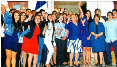
INCLUSIÓN. —Ayer, la Presidenta Michelle Bachelet recibió a un grupo de los 651 jóvenes que este año ingresará a la universidad y estudiará gratis gracias al programa de inclusión PACE.

El 65% de los postulantes de esos establecimientos quedó seleccionado, algo que en el caso de los pagados sube al 86%. Ante eso, expertos piden cambios en el sistema de admisión.