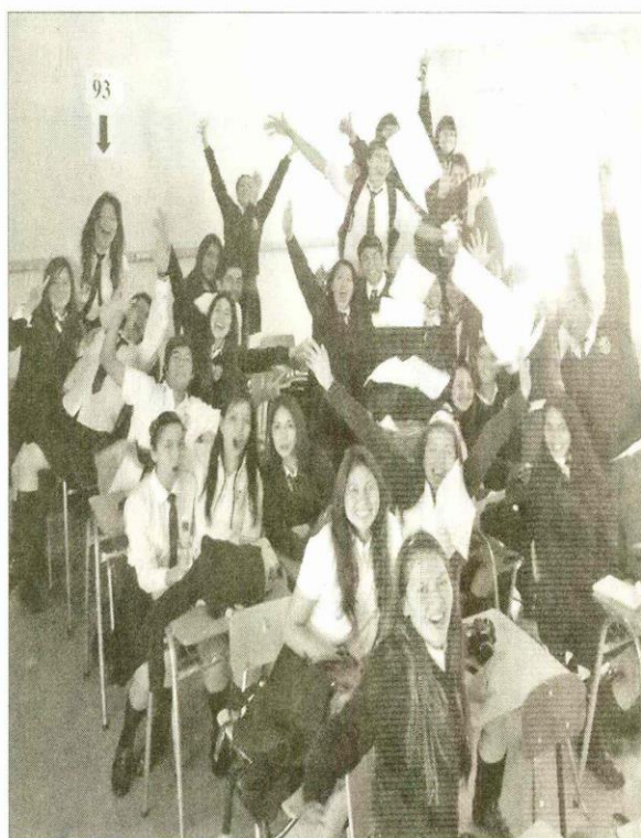
El año pasado, 44 de los 46 egresados de 4° medio del Liceo de Música de Copiapó se matricularon en la educación superior, el mejor resultado a nivel municipal de Chile.

El ranking va a favorecer a todos los buenos alumnos, aunque no significa que automáticamente van a quedar, sino que van a tener una bonificación. La selectividad no va a disminuir".