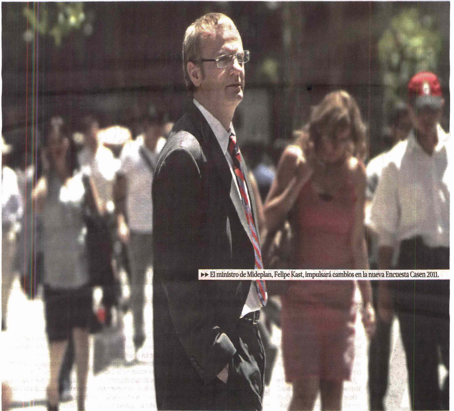
►► El ministro de Mideplan, Felipe Kast, impulsará cambios en la nueva Encuesta Casen 2011.