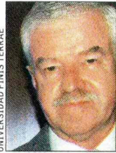
UNIVERSIDAD FINIS TERRAE

"Aquí hay una discriminación. No entiendo cuál es la razón por la cual no es posible que las universidades que pagan por acceder a esta base de datos no pueden hacerlo al mismo tiempo que las del Consejo de Rectores".