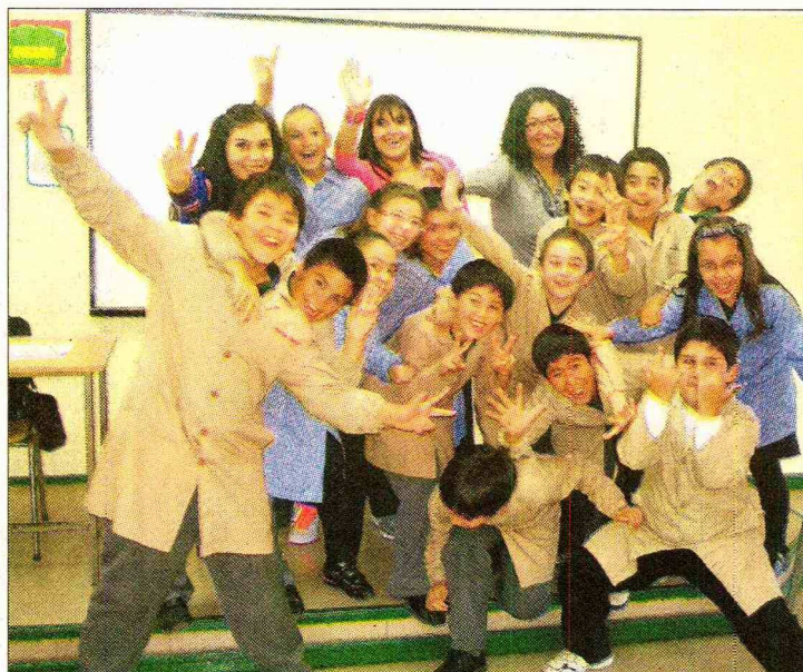
Los estudiantes del Colegio Constitución celebraron los resultados del Simce, pues superaron a los establecimientos tradicionales y privados de la capital.

La receta para tener buenos resultados es "el trabajo docente y la calidad de los alumnos que tenemos: motivados y autorregulados", dice la rectora. "El colegio tiene una cultura acostumbrada a la medición: hay una sana competencia de los cursos, y los profesores saben que los resultados tienen directa relación con lo que ellos hacen y no hacen", añade.