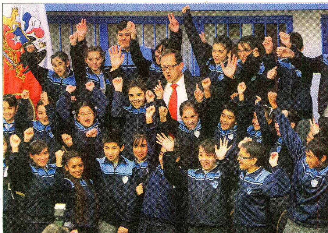
RESULTADOS. — El ministro de Educación, Harald Beyer, entregó y celebró los resultados de este Simce en el colegio Francisco Ramírez de San Ramón.

Este colegio logró los mejores resultados del país en cuarto y octavo básico .