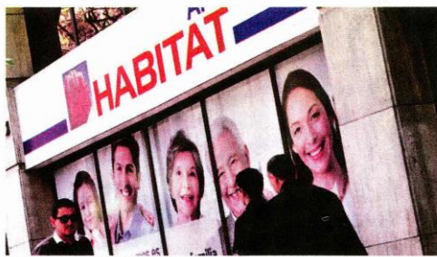
▶▶ AFP Habitat registró un alza de 81,2% por este ítem entre 2011 y 2016.