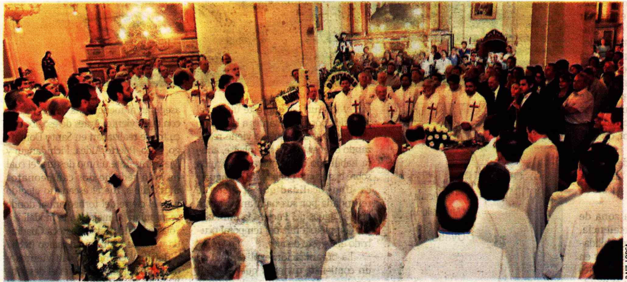
Sus restos eran velados en la Iglesia San Ignacio de Loyola. Cientos de personas llegaron al lugar.