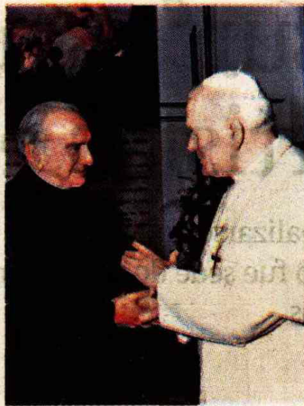
Poblete fue el impulsor en el Vaticano de la santificación del padre Alberto Hurtado.