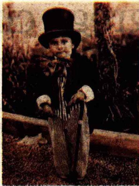
Durante su infancia, el sacerdote vivió junto con su familia en Oruro, Bolivia.