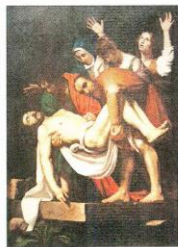
Una copia, ejecutada por un autor chileno desconocido, de "Descendimiento de la cruz", de Caravaggio.