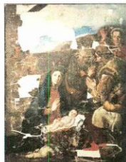
"La adoración de los pastores" (1877), de Cosme San Martín.