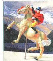
"Still Life" (Ferrer). 250 x 210 cm. Napoleón como Llanero Solitario.