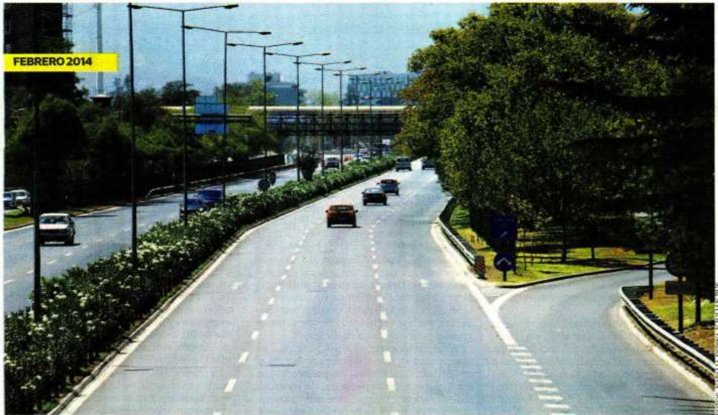
►► Más de 200 mil automóviles volverán a Santiago este lunes, cambiando radicalmente el paisaje.