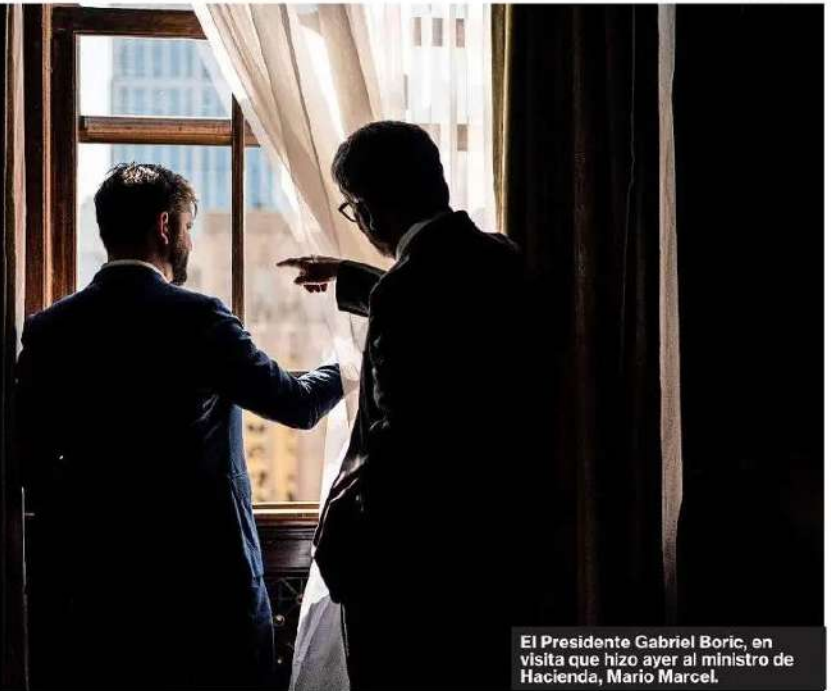
El Presidente Gabriel Boric, en visita que hizo ayer al ministro de Hacienda, Mario Marcel.

Con la buena cifra en mano, el ministro Marcel aprovechó de llamar a los empresarios a volver a invertir.