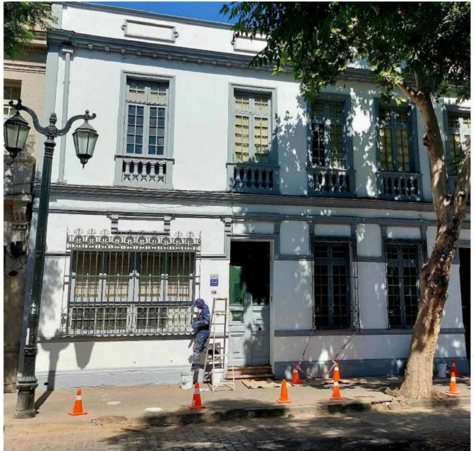
GENTILEZA ALTA PRESIÓN