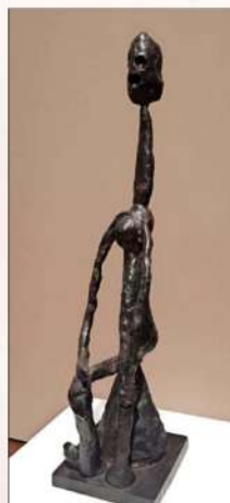
Su escultura minimalista y en metal es pionera, antes que Giacometti.

Un hecho notable es que esos volúmenes, de una estilización asombrosa, Picasso los trabajó antes que Giacometti (amigos y rivales). El Museo del Prado abordará en una muestra de cámara, pero de gran valor por el influjo de El Greco en Picasso. "Es una exposición muy significativa, porque Picasso fue director del Prado