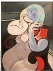
"Nudo en un sillón rojo", Pablo Picasso, 1934, habría pintado en cinco días este magnífico cuadro. Diversas estéticas y maestros influyen en él, como Rembrandt, Rousseau y El Greco.

También a orillas del Mediterráneo, en Barcelona, se preparan presentaciones. Un lugar imperdible es el Museo Picasso donde están sus "Meninas", que citan a Velázquez bajo el irreverente y seductor tamiz picassiano.