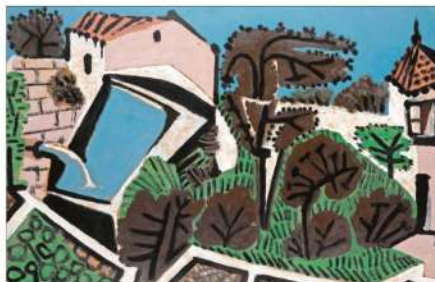
Picasso, "El estanque", acuarela. El artista nacido en Málaga abordó con maestría y pasión diversos temas, técnicas y disciplinas que abarcan el teatro y llegan al cine.

Pero el curador de las celebraciones de Picasso 2023, Carlos Alberdi, advierte: "Hay una pequeña inquisición contra Pablo Picasso, pero no creo que fuera un monstruo. No niego que fue machista, entiendo que lo fue y bastante, era un hombre del siglo XIX. Pero misógino, si atendemos a la acepción real, no. Demostró que no tenía aversión hacia las mujeres; trabajó con ellas y no solo como musas, sino también fueron colaboradoras suyas".