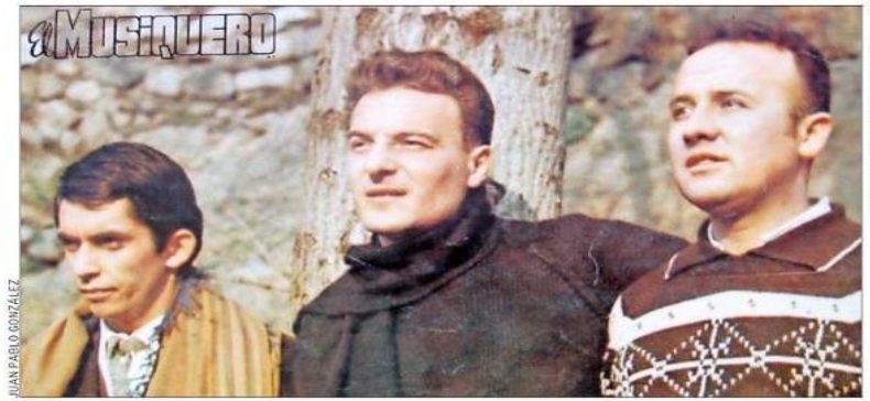
Ángel Parra, Patricio Manns y Rolando Alarcón, los tres nombres habituales en la Peña de los Parra en los años 60.

Tu legado musical quedará para siempre, nunca olvidaré nuestros ataques de risa tirados en el sillón y hablando de la vida y la música. Descansa, amigo mío”.