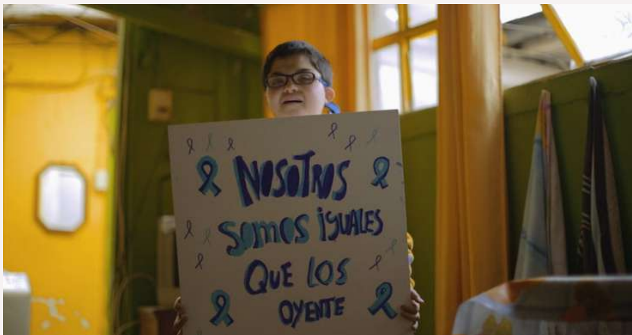
Documental "último Año", de Viviana Corvalán y Francisco Espinoza