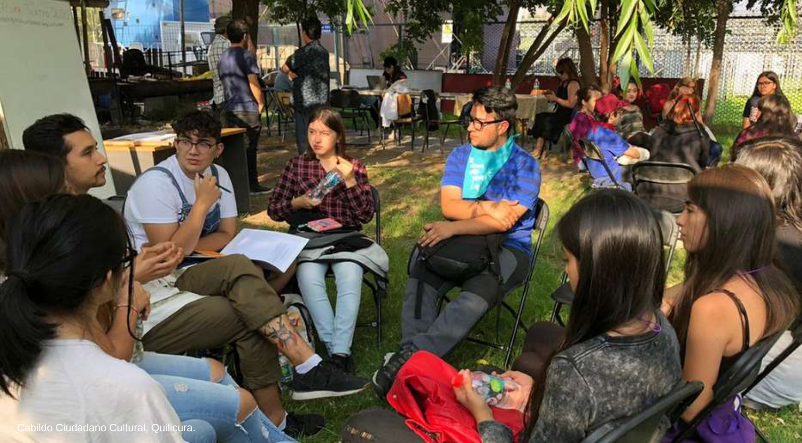
Cabildo Ciudadano Cultural, Quilicura.

¿Podría realizarse la representación igualitaria que imagina Rawls con las herramientas de la política? Al respecto es esclarecedor el trabajo de Philip Pettit (3) cuando revisa el llamado dilema discursivo de los grupos. Este consiste en la disyuntiva entre adoptar sus decisiones sumando la opinión de cada individuo del grupo sobre cuestiones racionalmente relacionadas, o favorecer la disciplina racional colectiva para que el grupo sea eficaz. Si se toma el primer camino el riesgo consiste en suscribir posturas incompatibles o incoherentes en el tiempo, y en el segundo caso el riesgo es adoptar como preferencias unas propuestas rechazadas por los individuos que integran el grupo. Pettit defiende que para incidir realmente sobre sus objetivos un grupo intencional “se verá presionado para imponer una disciplina racional a nivel colectivo” (p. 211). Este punto de vista concibe un sujeto colectivo que integra a las personas en una estructura de opinión y toma de decisiones colectivamente racionales, que se distingue de un conjunto de individuos racionales que solo suman sus preferencias. Tal vez los electores de nuestro país no quieren formar un grupo intencional consistente en el largo plazo (lo que se parece a la definición de un partido político), sino solo elegir como constituyentes a las mejores personas para que tomen decisiones exclusiva-